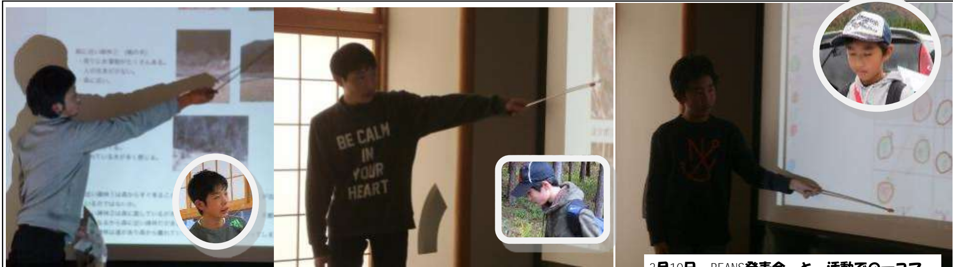
3月10日 BEANS発表会 と 活動での一コマ