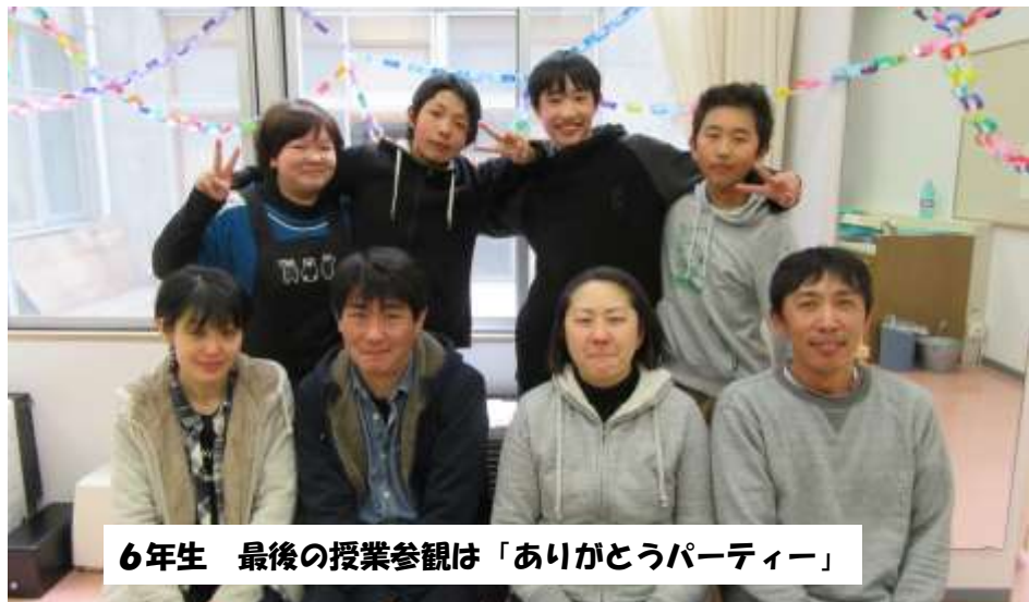
6年生 最後の授業参観は「ありがとうパーティー」

をあげました。中でも、三人の心に大きく残っているのは、わらべどんぐり祭りの劇の発表だったようです。一年間のことを思いだしながら、集大成の卒業式