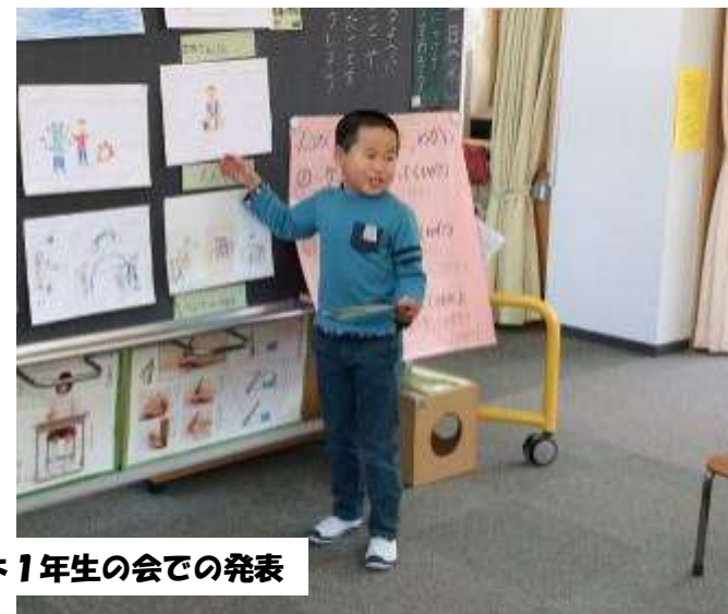
楽しかったよ1年生の会での発表