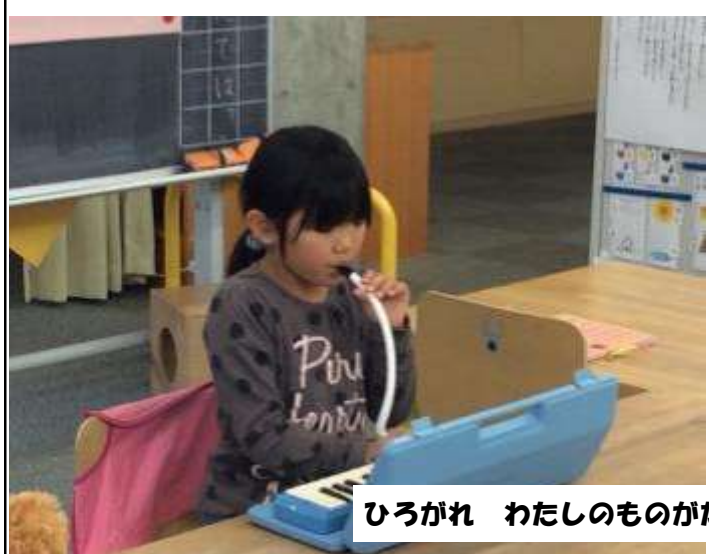
ひろがれ わたしのものがたり